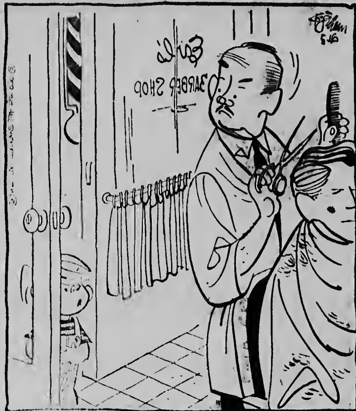
„Hoeveel moet ik je betalen om de haar van mijn witte muis te knippen?”